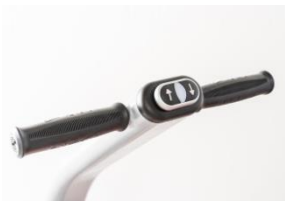
Griff und Leerlauftrad für manuelles Schieben