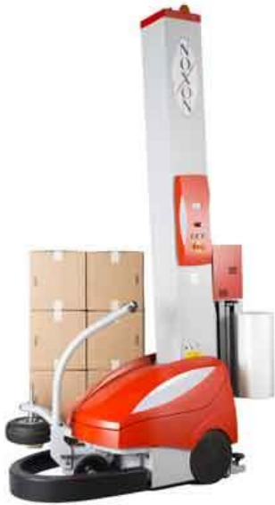
ROBOT MAS 2 - 212 Pre-Stretch 250% fix

Selbstfahrender Stretchwickler für bis zu 250 Paletten / Tag mit Pre-Stretch 250% fix